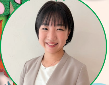
寺本 明日香氏 小牧市出身 元体操競技日本代表